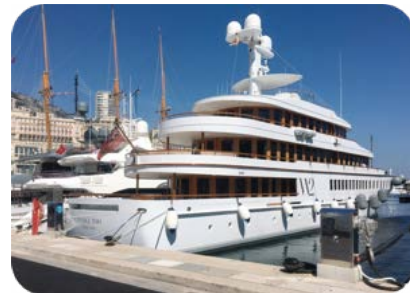
Port Hercule, Montecarlo (Monaco)